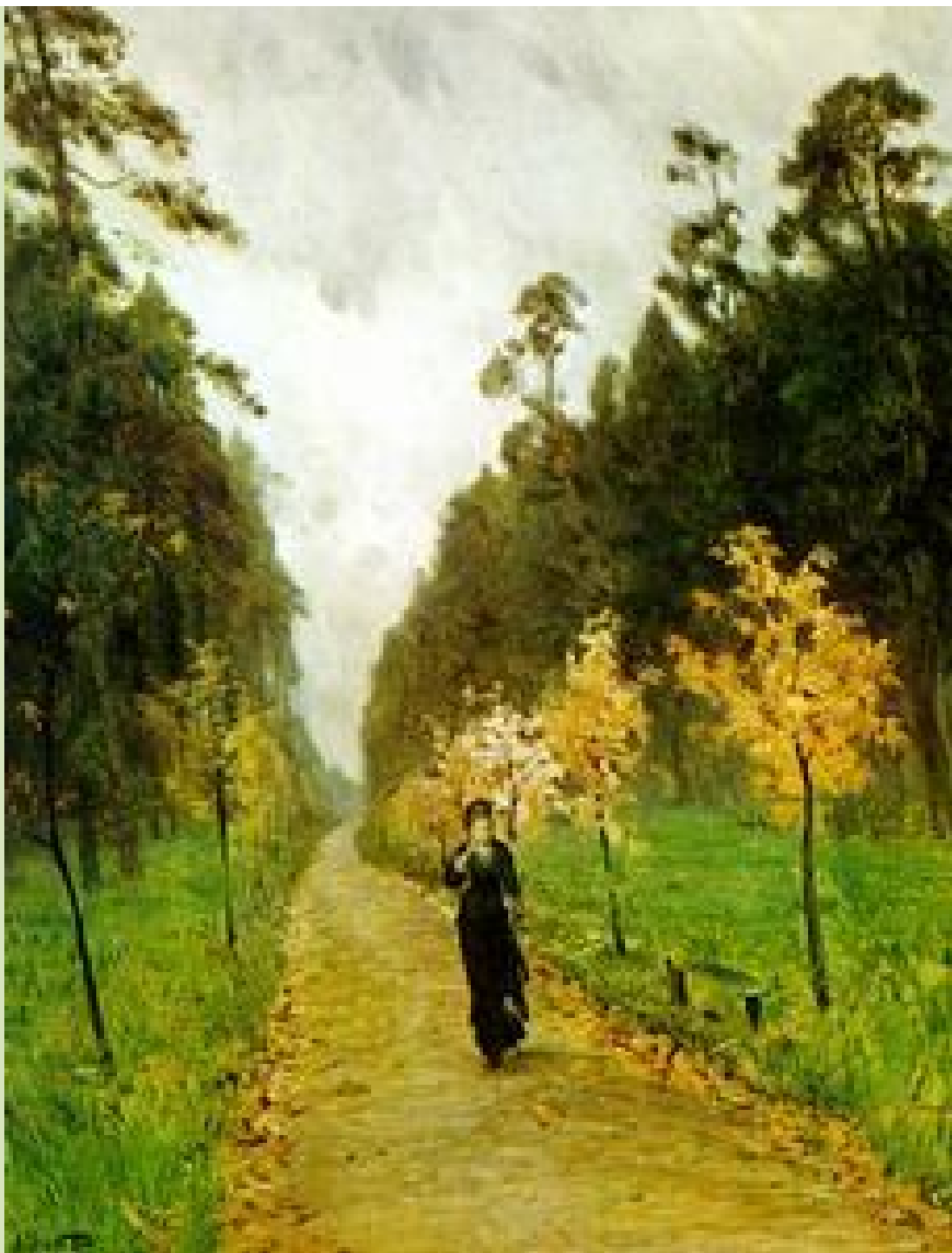
И. И. Левитан «Осенний день»