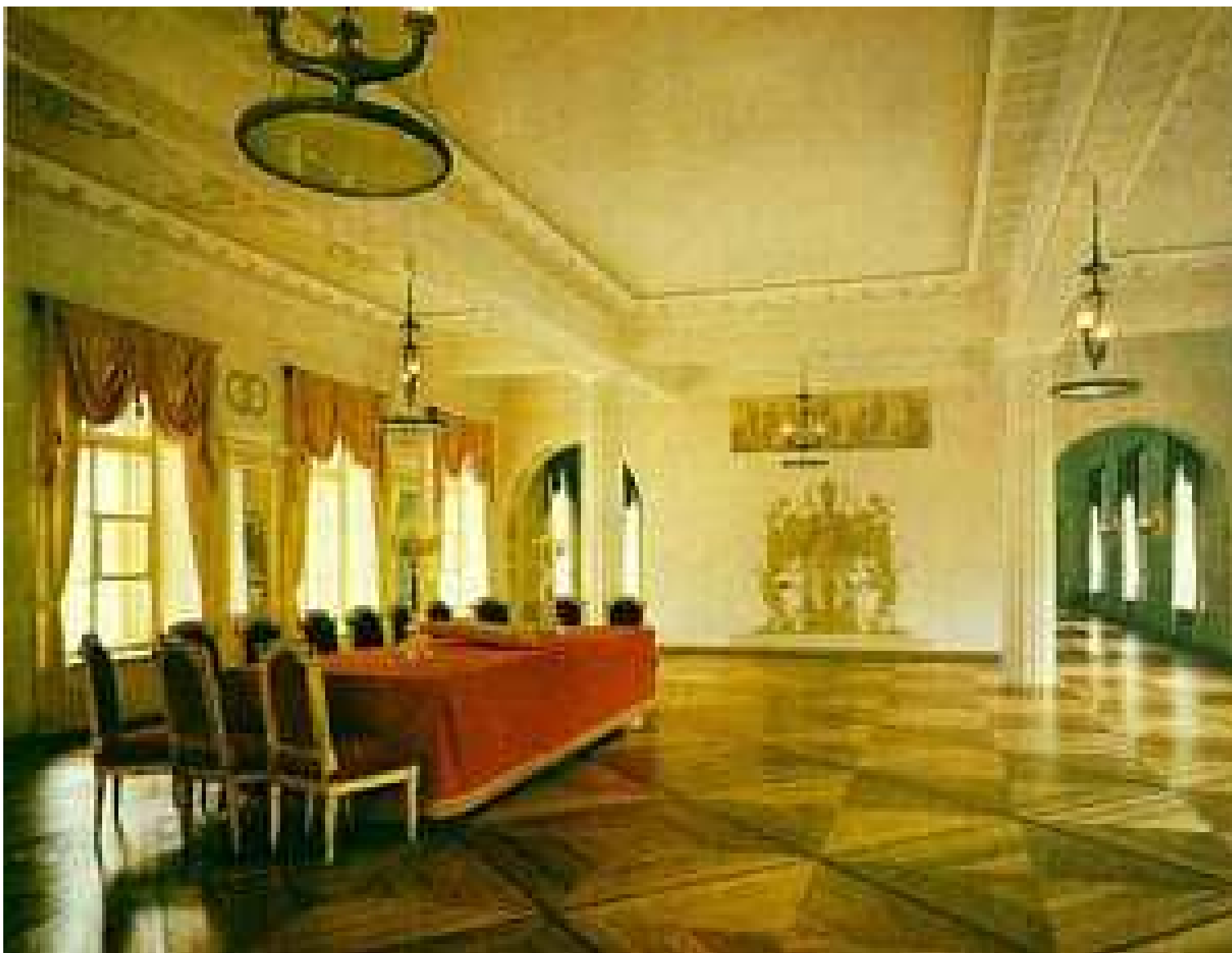
В. П. Стасов «Актный зал Лицея»