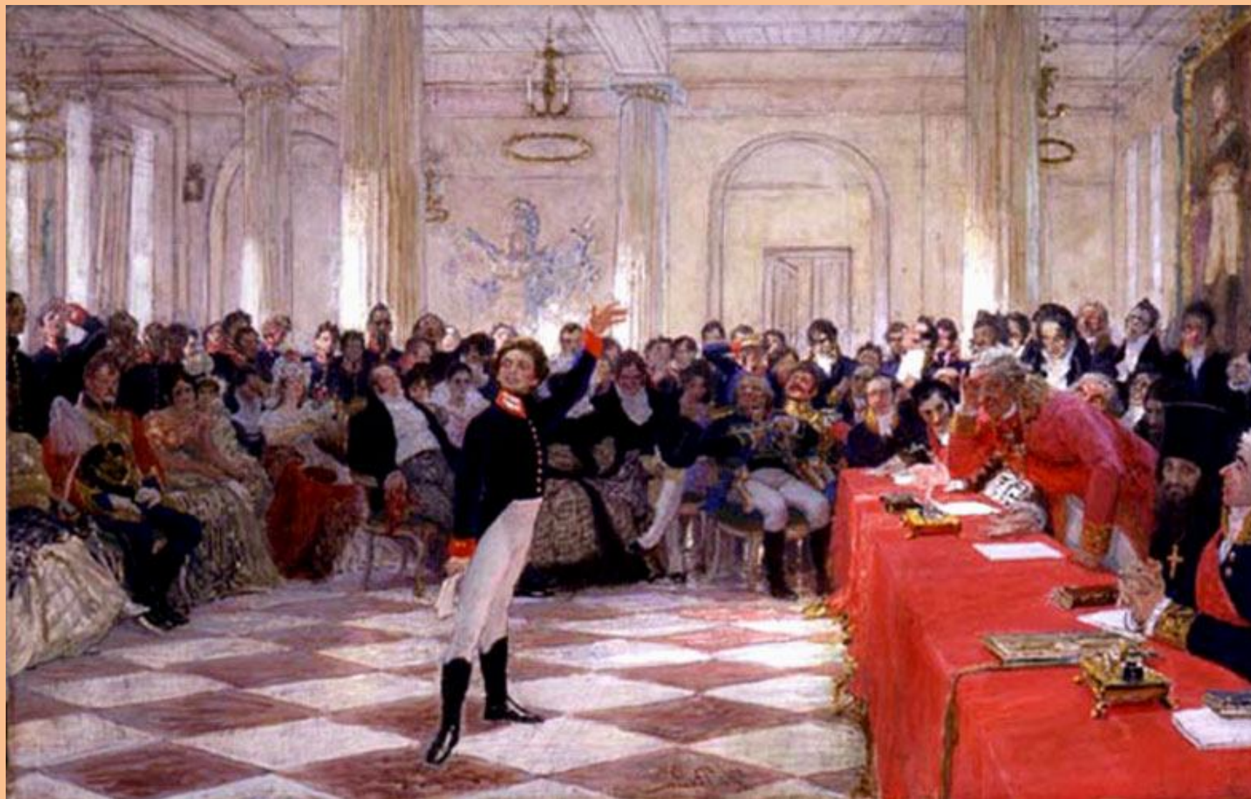
И.Репин «Пушкин на лицейском экзамене в Царском Селе»