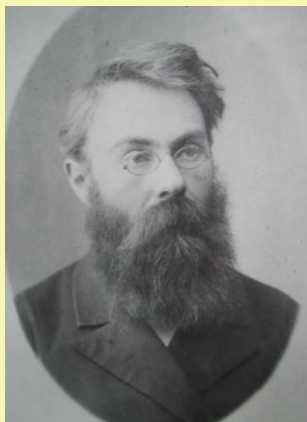
Порфирий Никитич Крылов