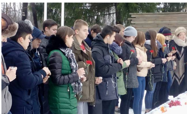
Участие в митинге, посвященном 73 годовщине освобождения Ленинграда от фашистов (27.01.2017)