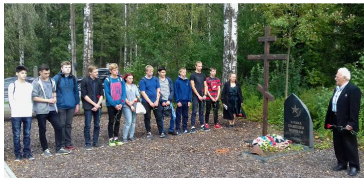
Участие в митинге, посвященном 76-летию начала блокады Ленинграда на братском захоронении д. Вартемяги (08.09.2016)